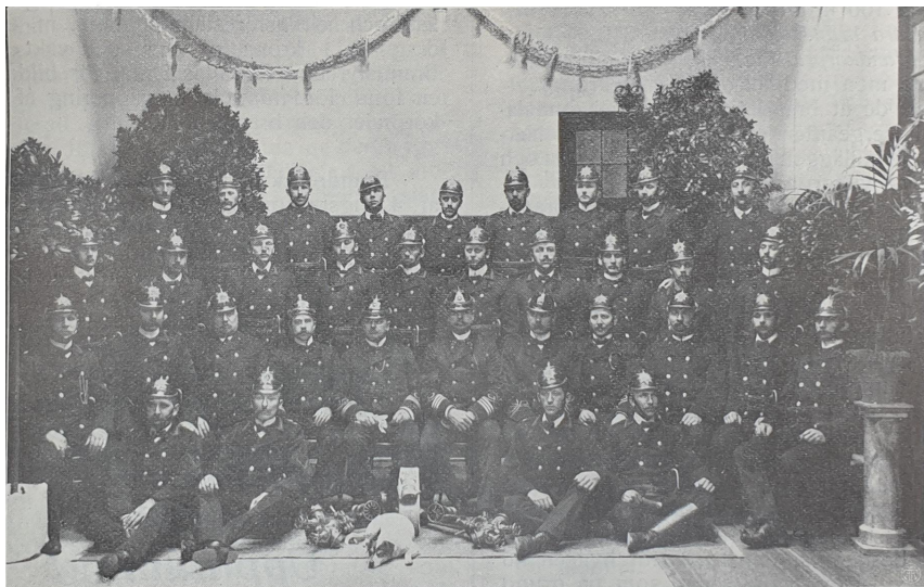
Grupp af Norrköpings brandkår.

Brandkårens personal utgöres jämlikt 1905 års brandordning af: